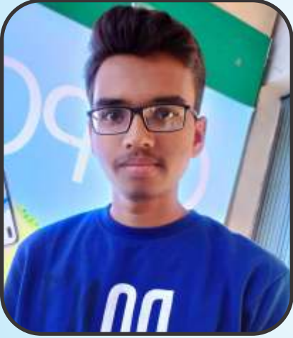
प्रजापतिद्रा ( संस्कृत )